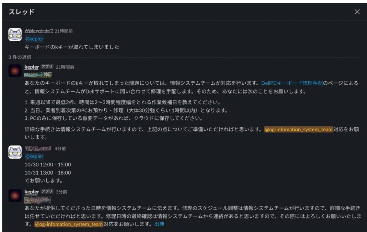
KEPLER が Slack 上で社員からの問い合わせに回答している様子